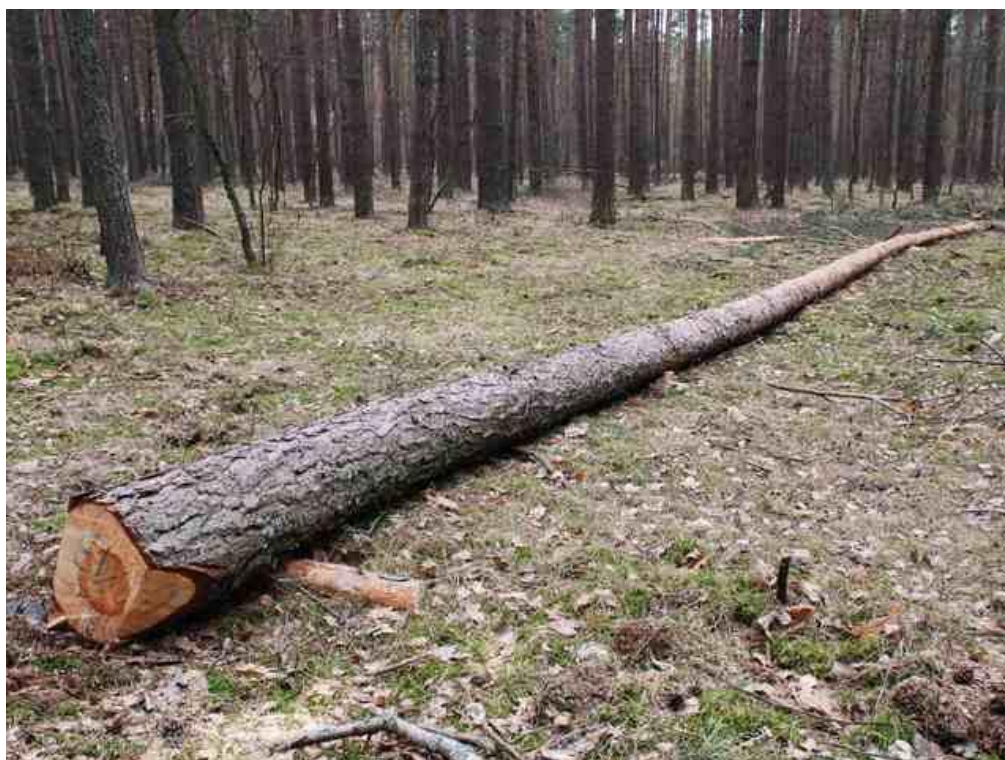
CETYNIEC WIĘKSZY – ( Tomicus piniperda ) oraz chodniki owadzie.